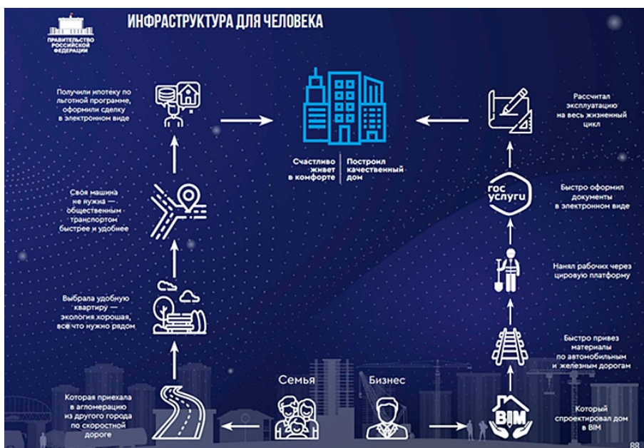
ПЛАН ВСЕРОССИЙСКОЙ РЕНОВАЦИИ

В декларациях Хуснуллина (о них ниже, там много интересного) ранее фигурировал "Мерседес" жены, но потом супруги развелись. Теперь у вице-преьера машины как бы нет и он хочет, чтобы его примеру (на слайде есть утверждение "Своя машина не нужна") последовали все жители самой большой страны мира.