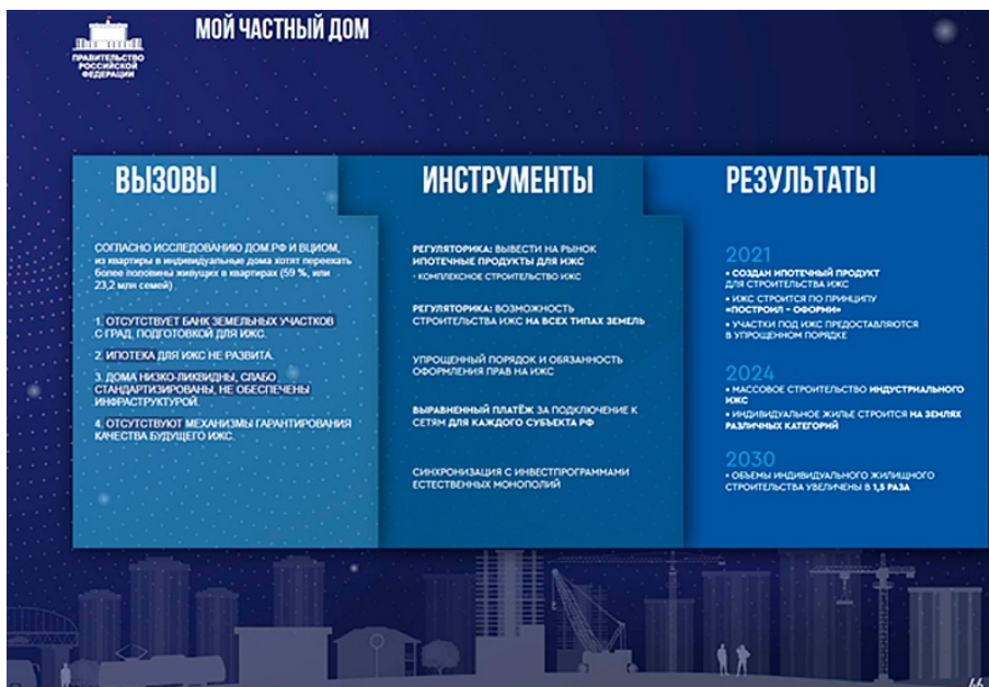
ПЛАН ВСЕРОССИЙСКОЙ РЕНОВАЦИИ

На 46-м слайде авторы наконец начинают говорить об индивидуальном жилищном строительстве – и тут же забывают о нём навсегда (на 47-м слайде лишь бессмысленная схема). Таким образом, в документе лишь одна страница из 127 полностью посвящена ИЖС. А ведь начинается она с сильного утверждения: