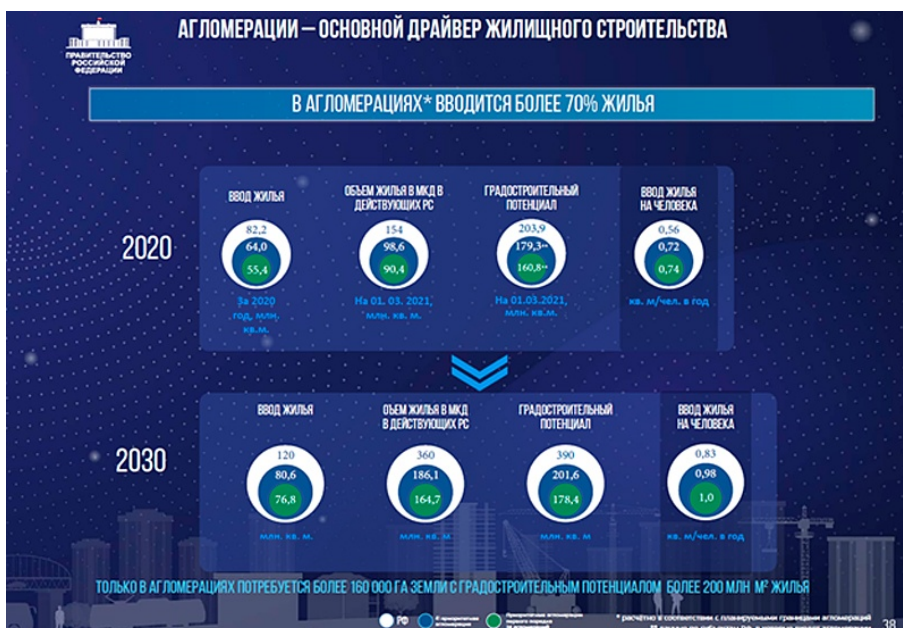
ПЛАН ВСЕРОССИЙСКОЙ РЕНОВАЦИИ / GOVERNMENT.RU

Придираться к точкам после "млн" уж не будем – это слишком сложно для агрессивных строителей, зато вчитаемся в тезис "Только в агломерациях потребуется более 160 000 га земли с градостроительным потенциалом более 200 млн м 2 жилья" .