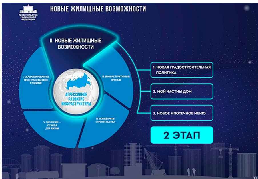
ПЛАН ВСЕРОССИЙСКОЙ РЕНОВАЦИИ