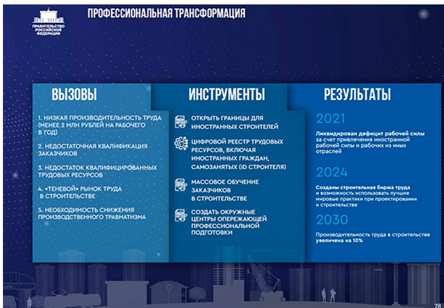
ПЛАН ВСЕРОССИЙСКОЙ РЕНОВАЦИИ

Хуснуллин пытается контролировать рынок труда России через набор приезжих из Средней Азии, не имеющих понятия об укладе жизни в большом многоконфессиональном государстве, приносящих сюда свои обычаи, часть которых неприемлема для России. В последнее время практически ежедневно происходят драки с участием мигрантов ( раз, два, три, четыре, пять – надо больше их нанять), причём стороны практически всегда чётко разделены по национальному признаку.